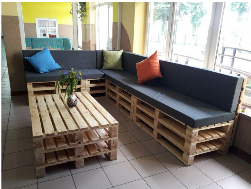
Szkoła Podstawowa w Ostrowążu